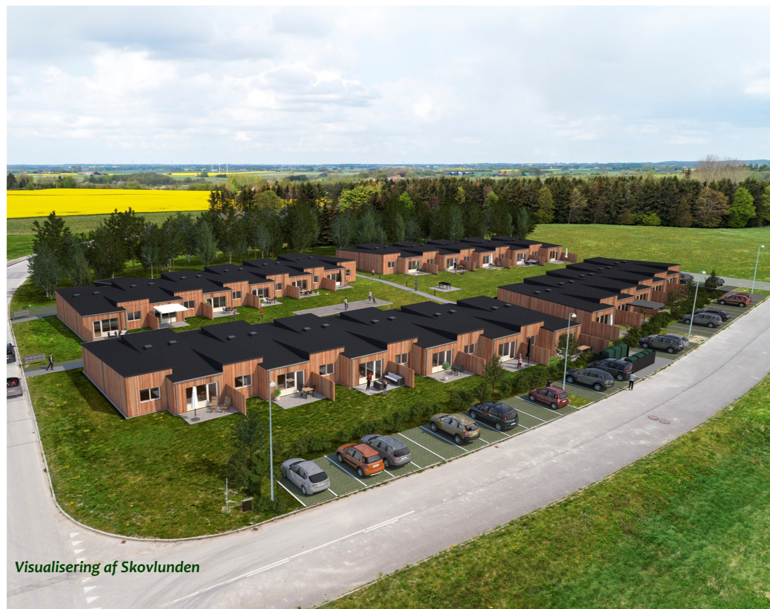
Visualisering af Skovlunden